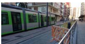
Arrancan las obras de la segunda marquesina del tranvía en Angulema